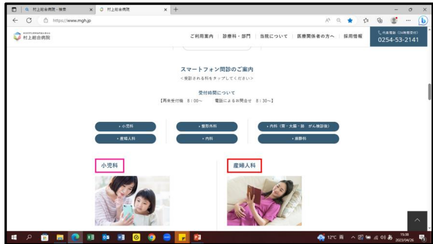
(↑当院HP スマートフォン問診画面)